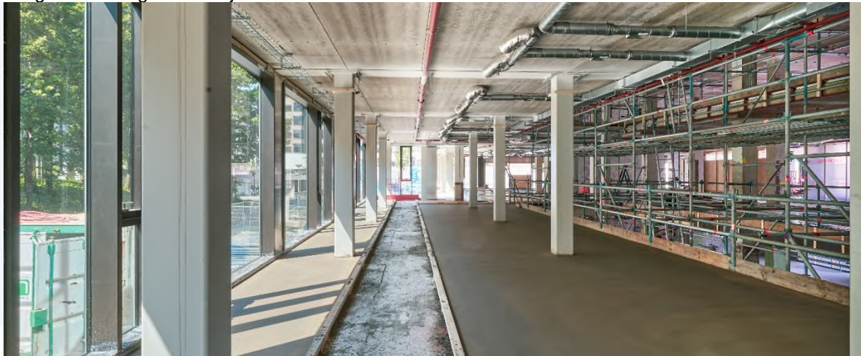
afbeelding 3 zandcement dekvloer

Er wordt in het gebouw op elke verdieping een nieuwe zandcement dekvloer aangebracht. De dekvloer wordt met grote slangen in het gebouw gepompt middels een pompwagen op de bouwplaats. Dit pompen maakt geluid en u zal dit in de omgeving horen, om overlast te reduceren hebben wij een akoestisch geluidscherm om de pompwagen geplaatst. De planning is dat week 30 alle dekvloeren in het gebouw aangebracht zijn.