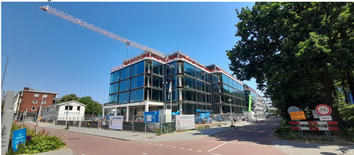
afbeelding 1 Aluminium gevel PI59

De grote aluminium geveldelen rondom het gebouw zijn nagenoeg allemaal geplaatst. Het ronde glas, op de hoeken, wordt als laatste gemonteerd en aansluitend volgen de detail afwerkingen van de gevel. De glaspanelen van het atrium aan de voorgevel vormen het sluit-stuk van de gevel. Deze atriumgevel wordt t/m ca. week 37 geplaatst. Als de gehele aluminiumgevel wind- en waterdicht is kan de afbouw binnen in het gebouw starten.