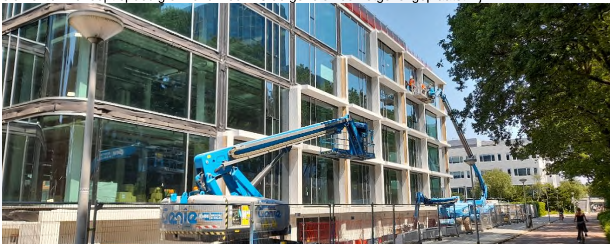
afbeelding 2 voortgang siergevel

De witte betonnen siergevel wordt gestaagd rondom het gebouw geplaatst. De montage van de grote elementen verloopt spoedig en rond week 40 de gehele voorzetgevel geplaatst zijn.