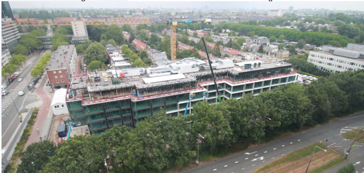
afbeelding 5 dakverdieping met installatiekasten

Op het dak van de dakopbouw is gestart met het plaatsen, afmonteren en het inregelen van de installatie kasten. Een groot deel van de bouwinstallatie wordt vanaf dit dak gevoed.