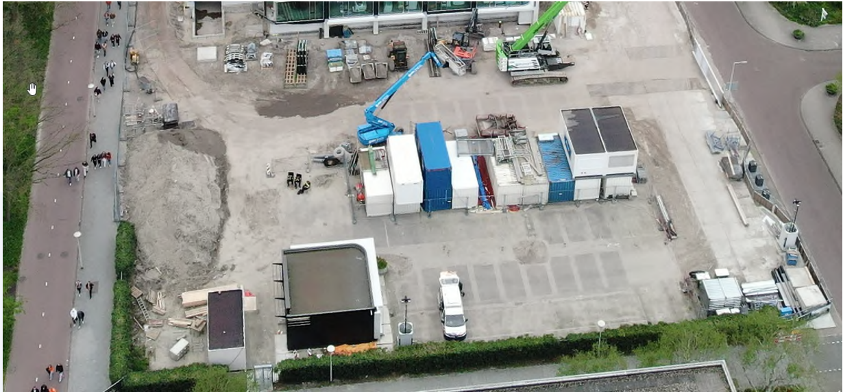
afbeelding 6 werkerrein parkeergarage