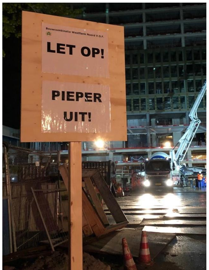
Afbeelding 3: Herinnering voor de chauffeurs van de betonmixers om geluidsoverlast zo veel mogelijk te beperken.