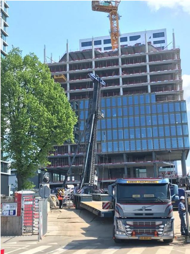
Foto 7: Zicht op Central Park met het aanbrengen van gevelelementen, en het plaatsen van de heistelling voor de palen van Fase 3B/3C.