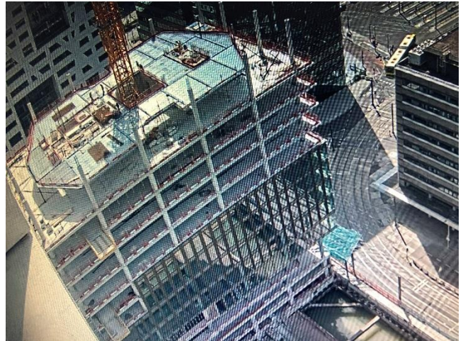
Foto 6: Webcamfoto d.d. 09.05.2020 met zicht op Central Park.