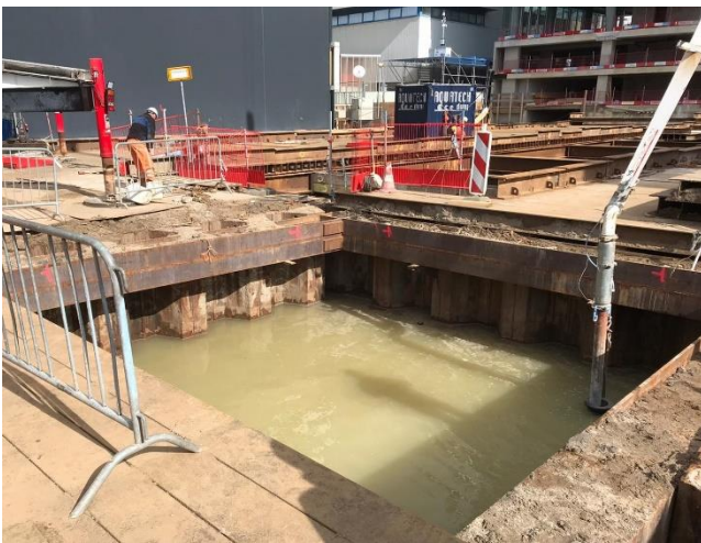
Foto 5: Het laatste beton (trappenhuis van woontoren Fase 3B/3C) wordt hier gestort.

Naast het storten van het beton ten behoeve van de parkeergarage is er natuurlijk nog veel meer gebeurd op de bouwplaats. Het aanbrengen van de installaties in 'Central Park' gaat onverminderd voort. Ook groeit het gebouw aardig in hoogte. Op dit moment zijn we al op de 12 e verdieping beland. Dat is op foto 6 goed te zien. Op de 11 e en 12 e verdieping wordt de zogenaamde 'insnoering' gebouwd, oftewel het park waar de kantoortoren haar naam aan te danken heeft. Ook is op foto 6 goed te zien dat de elementengevel het gebouw steeds meer 'dicht' zet. Per verdieping neemt het plaatsen van de gevels circa 8 / 9 dagen in beslag.