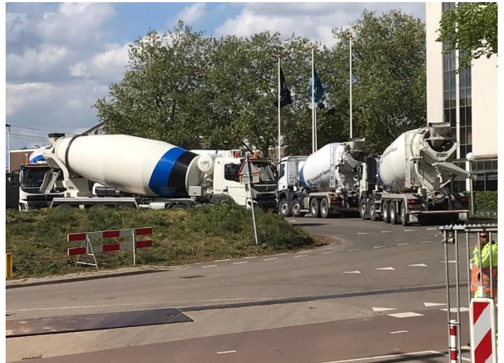
Afbeelding 2: Colonne betonmixers klaar om bouwplaats op te rijden.