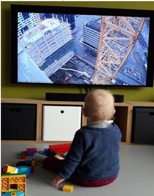
Foto 1: Ook onze jongste collega kijkt net als de andere thuiswerkers vanuit huis naar de betonstort.

Het is niemand ontgaan dat de maand april een drukke maand is geweest op de bouwplaats, met als finale paradepaardje de stort van het beton in de met water gevulde bouwkuip. In 34,5 uur is er 2.785m 3 beton gestort. Beton dat in 300 ritten is aangevoerd vanuit de betoncentrale in Nieuwegein naar de bouwplaats in hartje Utrecht.