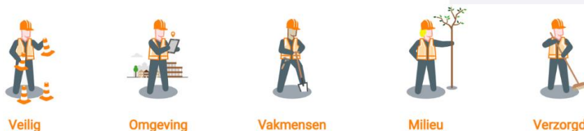
afbeelding 1; bewuste bouwers

Dit project is aangemeld bij Bewuste Bouwers. Bewuste Bouwers wil de relatie tussen bouwplaats en omgeving transparant maken door het stimuleren en bevorderen van goede communicatie en een goede uitstraling van de bouwplaats. Het bouwterrein en al onze medewerkers hebben zich gecommitteerd aan de uitgangspunten van Bewuste Bouwers. U kunt op www.verbeterdebouw.nl uw bevinden met ons delen en op ww.bewusterbouwer.nl meer lezen dit initiatief.